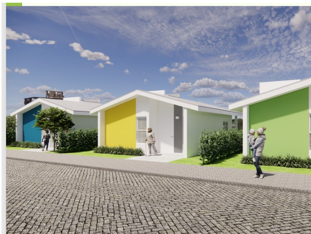
Imagem 02 – Ilustração das unidades habitacionais

O Programa “Casa Catarina” é uma iniciativa do Governo do Estado de Santa Catarina, por meio da Secretaria de Estado da Assistência Social, Mulher e Família (SAS), que visa promover o direito à moradia digna às famílias catarinenses. Nesta modalidade, são destinados recursos para a construção de unidades habitacionais para os municípios. O intuito é de beneficiar famílias de baixa renda, que serão selecionadas por meio de edital publicado pelo município. A Imagem 02 apresenta uma ilustração das unidades a serem construídas.